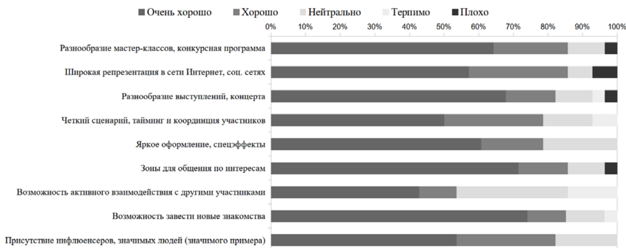
Рис. 1. Комплекс представлений о мероприятии, анализируемый на первом этапе анализа и интерпретации

С появлением этой проблемы мы переходим на второй аналитический этап.