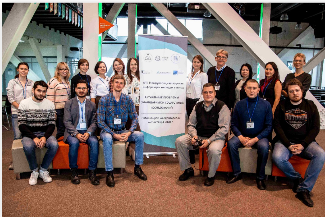
Фото 8. Участники XVIII Международной научной конференции молодых ученых «Актуальные проблемы гуманитарных и социальных исследований», г. Новосибирск, 6-7 октября 2020 г.