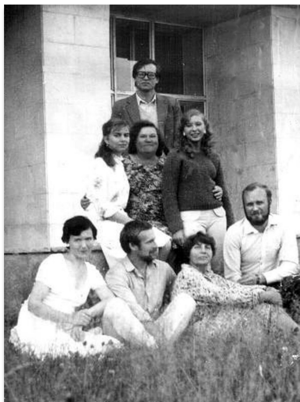
Фото 3. Группа этносоциологов: Вторая половина 80-х годов.

Социологические исследования в Институте с самого начала были сконцентрированы на этносоциальных проблемах народов Сибири и Севера. Теоретические обобщения по мониторингу социальной ситуации, совмещавшиеся с продолжительной экспедиционной работой в отдаленных районах Сибири, становились основой для записок и рекомендаций, в дальнейшем используемых в программах развития и сохранения народов сибирского региона.