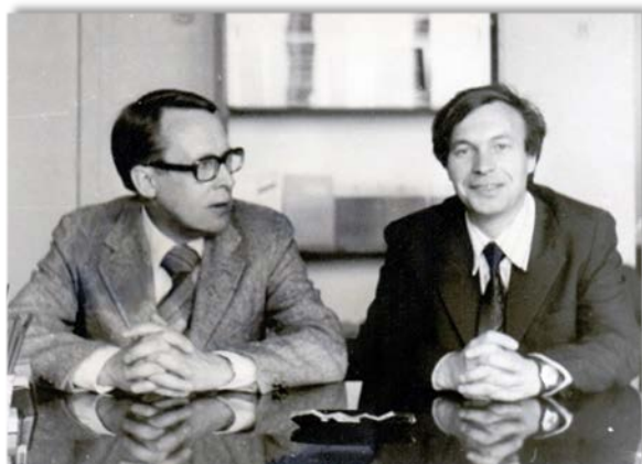
Фото 1. Известный финский логик Якко Хинтика с В.В. Целищевым (директор ИФПР СО РАН с 1997 г. по 2017 г.).

Философия была представлена исследованиями в трех направлениях: логика и теория познания, методология и философия науки, история философии. Каждое из этих направлений быстро обрело специфику и профиль, ориентированные на мировые тренды. Специфика состояла в том,