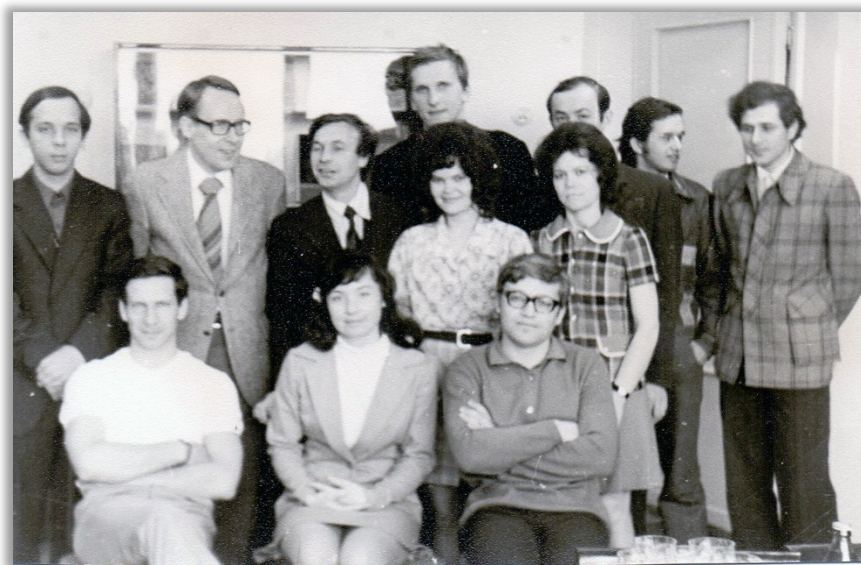
Фото 2. Сотрудники отдела философии. Середина 70-х гг

что в отличие от всех других гуманитарных наук в Сибирском отделении, тематика которых определялась региональными рамками, философская тематика определялась общими для мировой философии проблемами. Одной из важных особенностей развития философских исследований по логике и методологии науки явился тесный контакт с рядом школ в области математики и естественных наук в рамках Сибирского отделения, равно тесные контакты с зарубежными институтами и исследователями аналитической философии и философской логики. Также «фирменной» особенностью Института стали исследования в области античной философии, начало которым было положено в 1997 году.