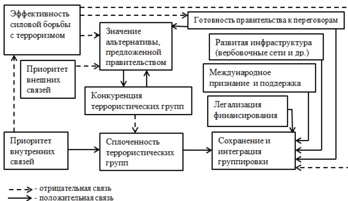
Рис. 2. Сохранение и интеграция группировки в легитимный политический процесс

Делая выводы, необходимо подчеркнуть, что результаты имеют лишь предварительный характер, полученные теоретические конструкции требуют дальнейшего уточнения понятийного аппарата и верификации причинно-следственных связей. Но уже сейчас видно, что полученная типология, теоретическая модель и обозначенные способы интеграции могут быть основанием анализа и интерпретации конкретных случаев интеграции террористических группировок в легитимный политический процесс.